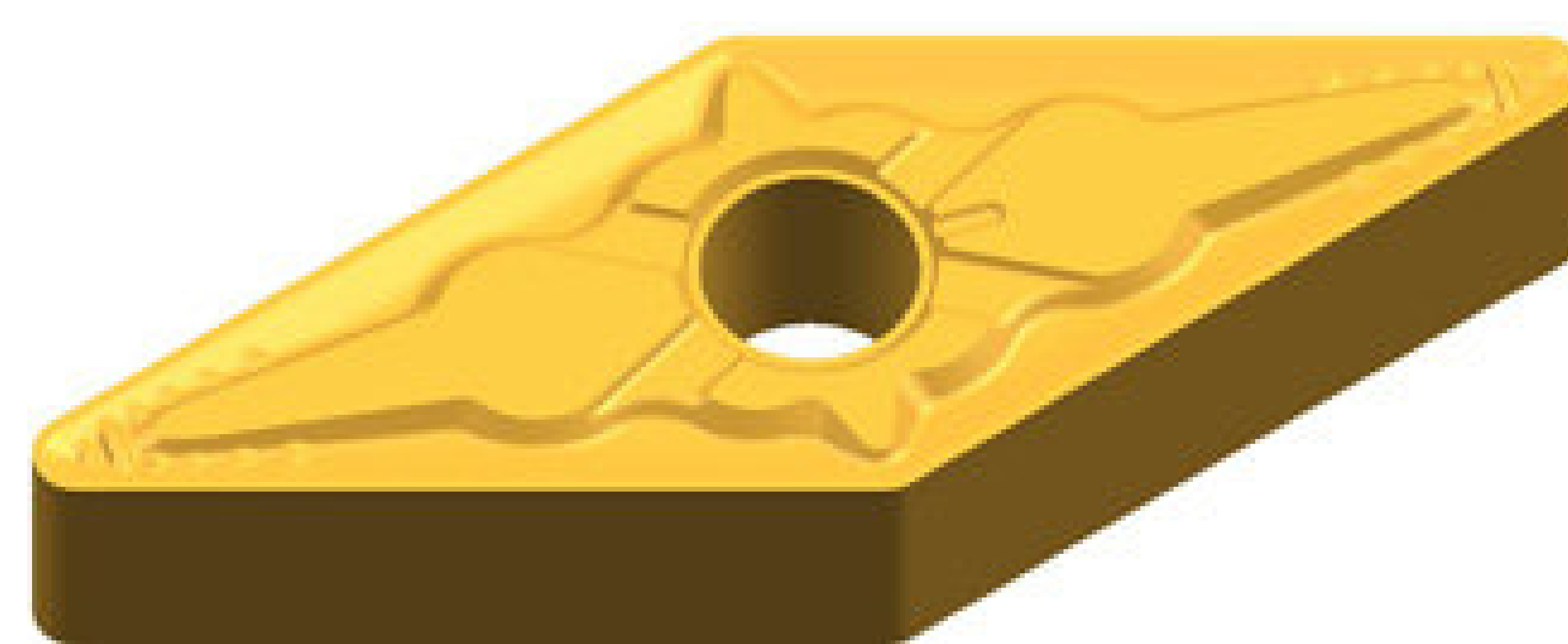
VNMG 1604-QM 17,4 PLN