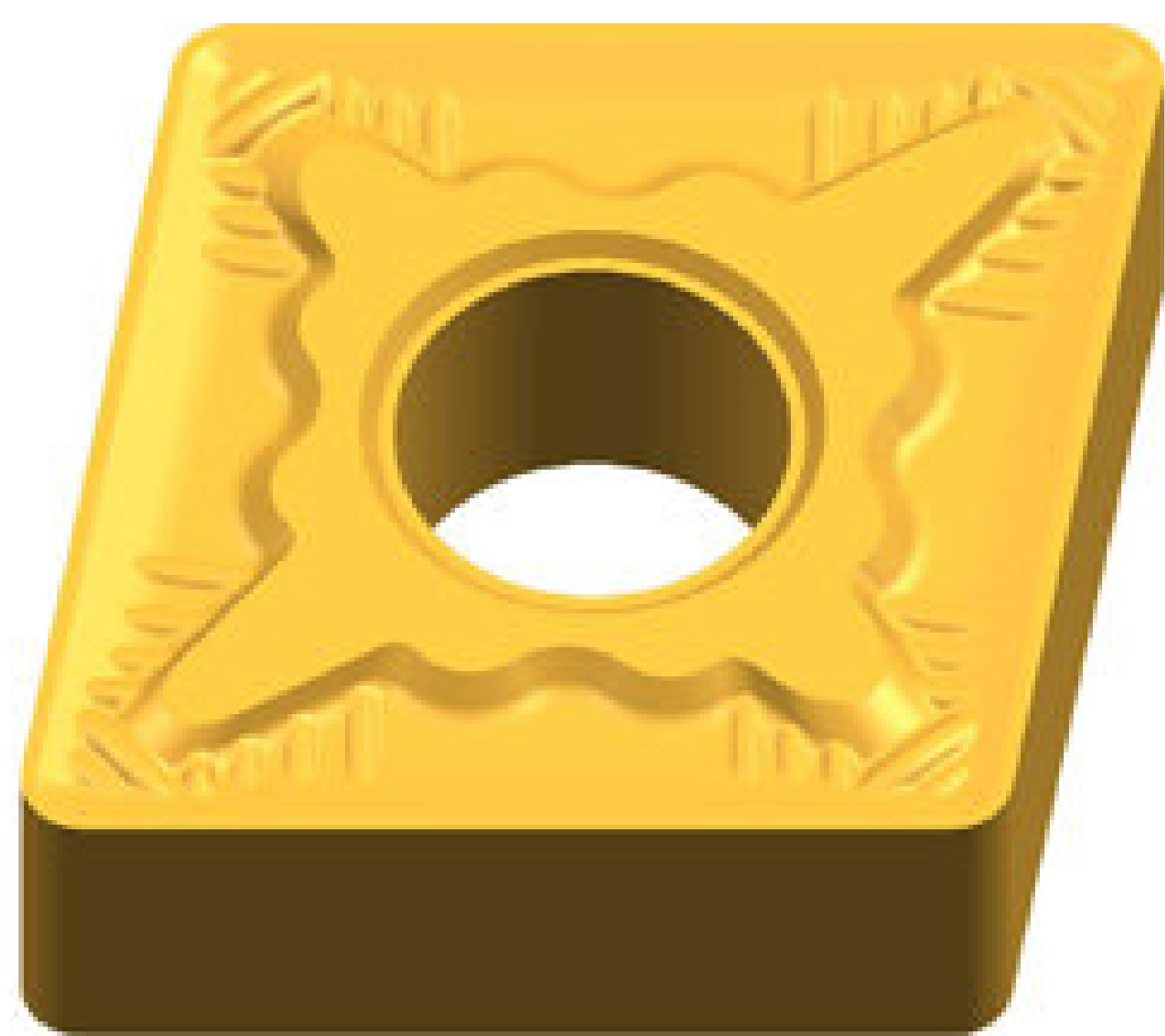
CNGM 1204-QM 17,4 PLN

Przy zakupie 100szt. dodatkowe 10% rabatu