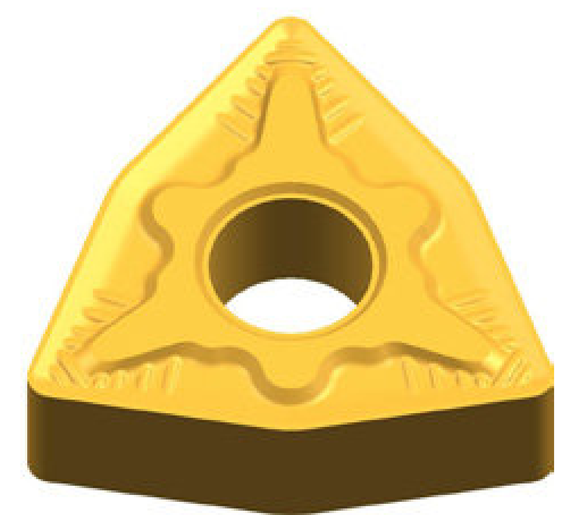
WNMG 0804-QM 17,4 PLN