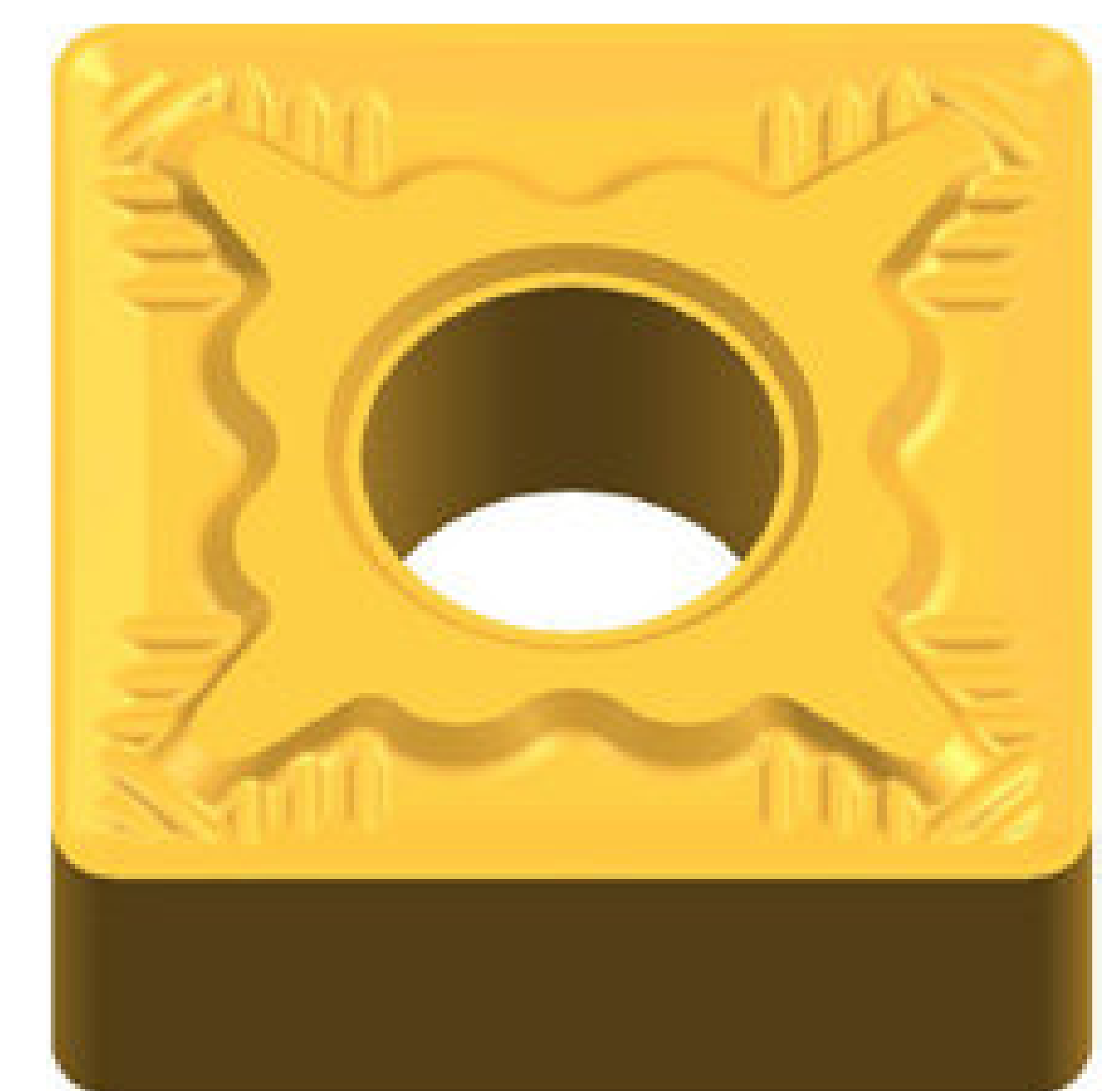
SNMG 1204-QM 16,1 PLN