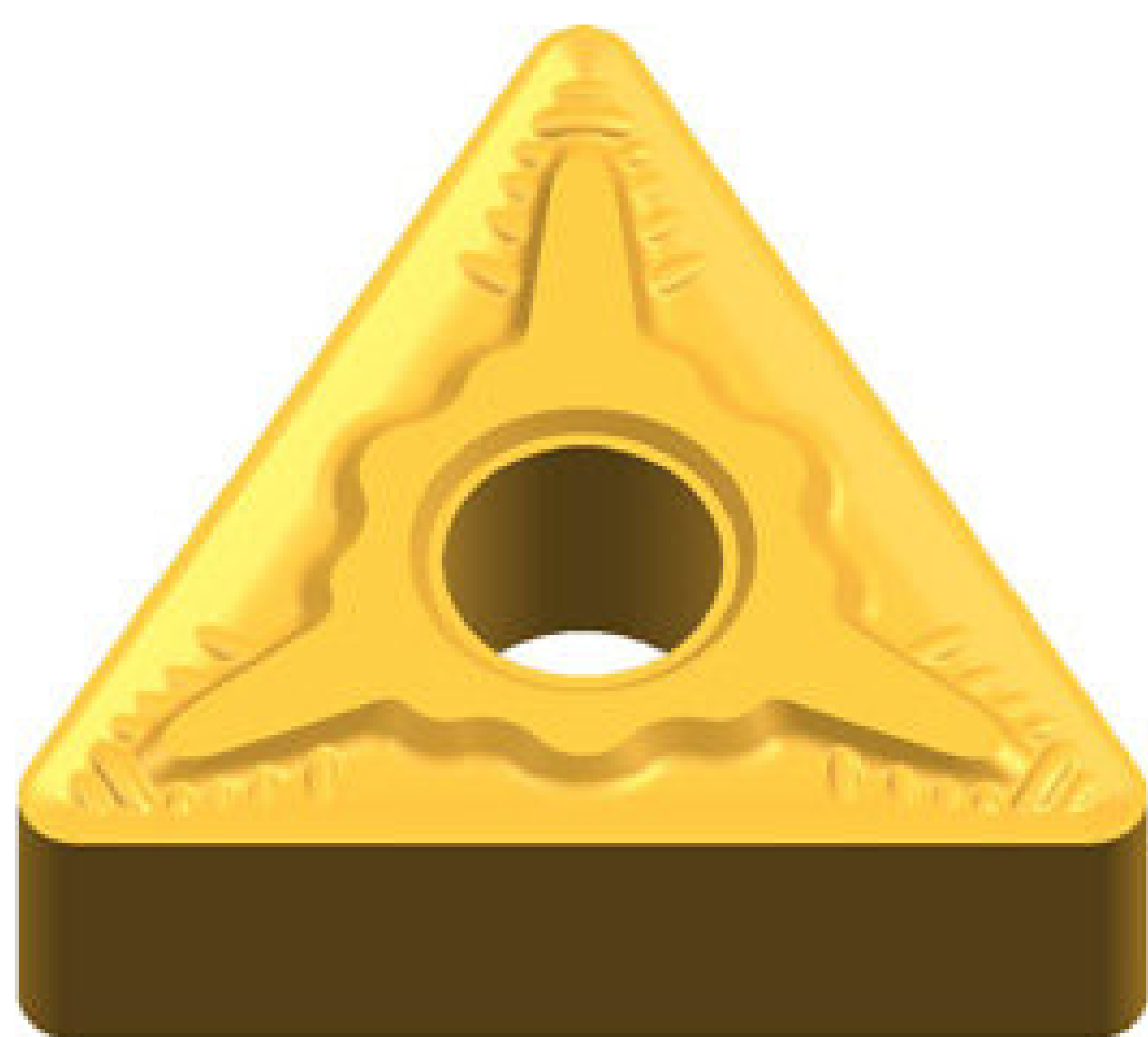
TNMG 1604-QM 15,4 PLN