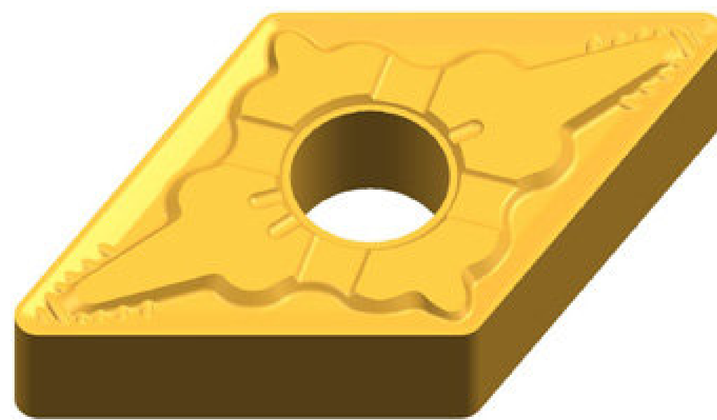
DNMG 1504-QM 17,4 PLN